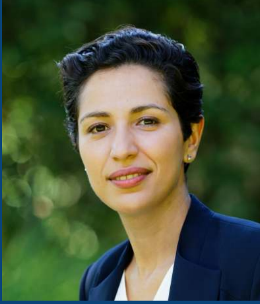
Sarah El Haïry, secrétaire d'État chargée de la Jeunesse et de l'Engagement